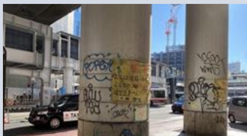
【掲出前】 落書きが多発していた橋脚