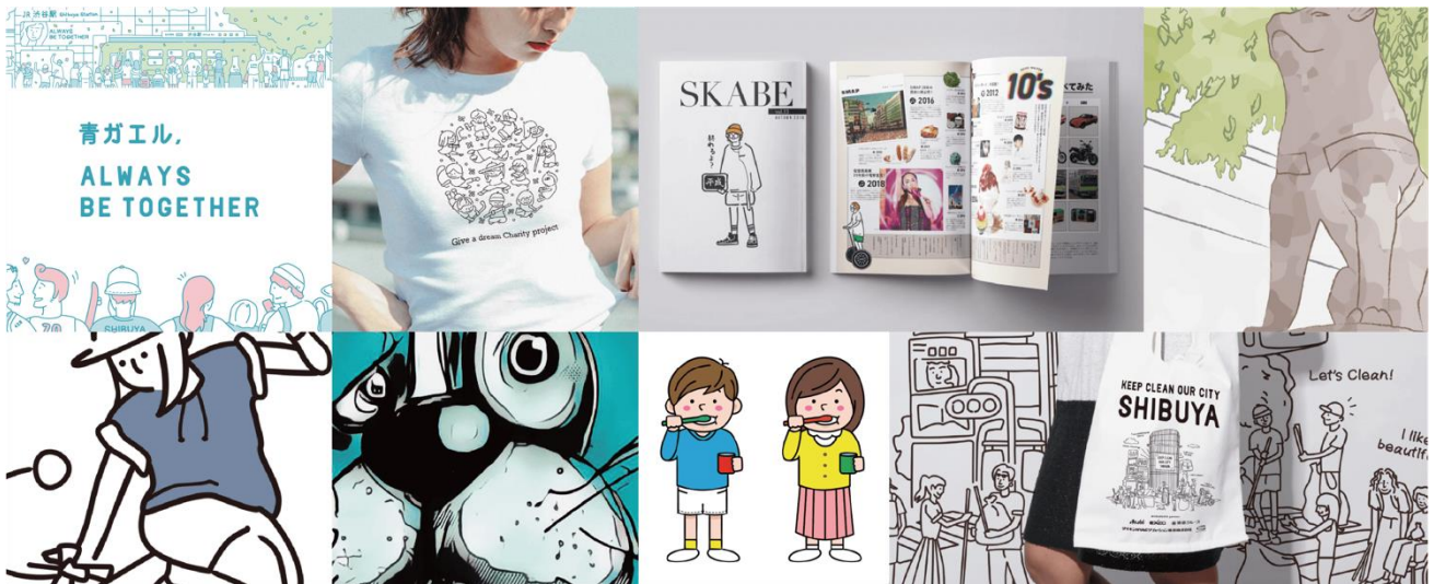
大橋祥氏の今までの作品