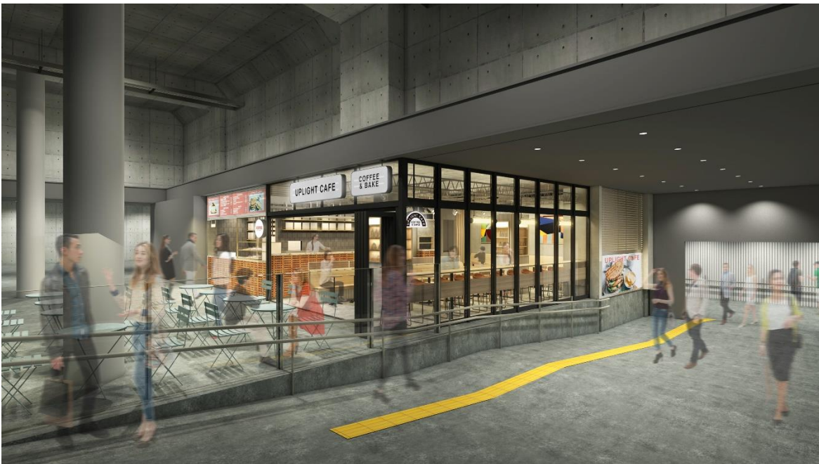
UPLIGHT CAFE イメージ

この他、店内に設置されたデジタルサイネージや展示スペースによる渋谷の観光・イベント情報発信や、店内のプロモーション空間を一体的に活用した企画など、渋谷における情報発信拠点としての機能も担っていきます。