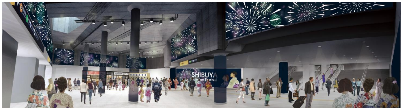
渋谷駅東口地下広場イメージ

渋谷駅では、渋谷駅街区土地区画整理事業によって整備される渋谷駅東口地下広場（以下、東口地下広場）が11月1日（金）に一部供用が開始される予定です。（別紙1参照）その東口地下広場に、東京都・渋谷区・一般社団法人渋谷駅前エリアマネジメント（以下、渋谷エリマネ）の公民連携の取組みにより、渋谷駅を利用されるお客さまの利便性や快適性を高めるための施設が誕生します。